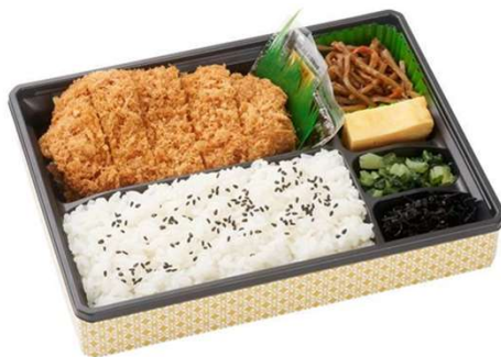
ローズかつ弁当 968円(税込価格) (本体価格880円)