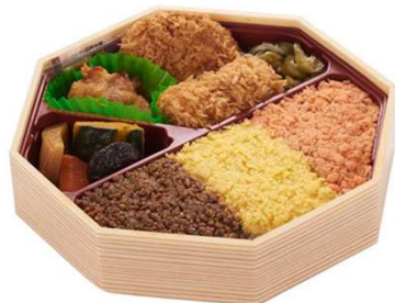
いろどり弁当 1,144円(税込価格) (本体価格1,040円)