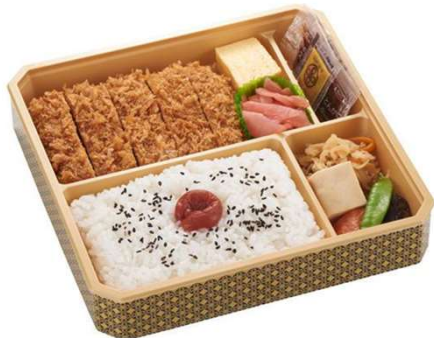
やわらかヒレかつ弁当 1,265円(税込価格) (本体価格1,150円)