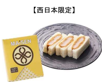
【西日本限定】 ヒレかつサンドハニーマスタード 3切 473円(税込価格) (本体価格430円)