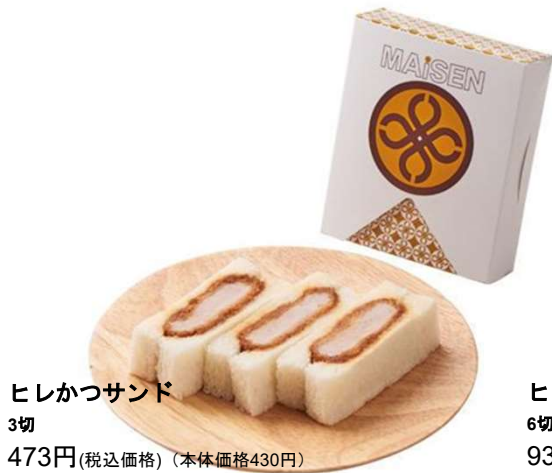
ヒレかつサンド 3切 473円(税込価格) (本体価格430円)