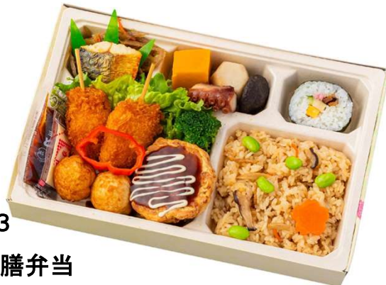
No. 8 1 3 なにわ御膳弁当