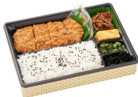
ヒレかつ弁当 1,012円(税込価格) (本体価格920円)