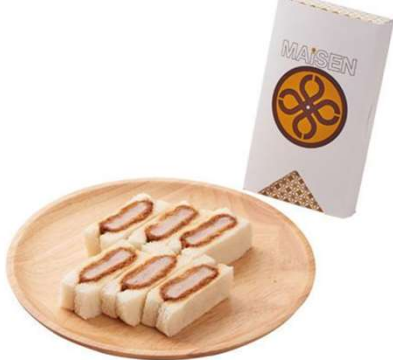
ヒレかつサンド 6切 930円(税込価格) (本体価格 845円)