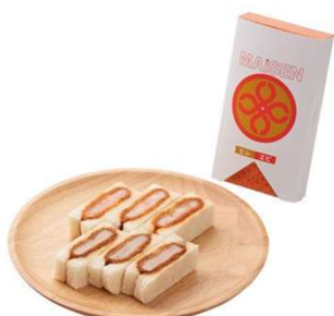
ミックスサンド(ヒレ・エビ) 各3切 963円(税込価格) (本体価格875円)