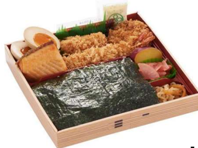
ごちそう海苔弁当 1,232円(税込価格) (本体価格1,120円)