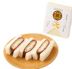
チーズメンチかつサンド 3切 473円(税込価格) (本体価格430円)