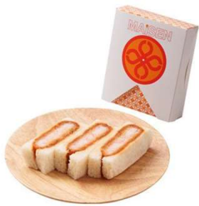
エビかつサンド 3切 506円(税込価格) (本体価格460円)