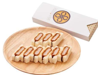
ヒレかつサンド 9切 1,364円(税込価格) (本体価格1,240円)